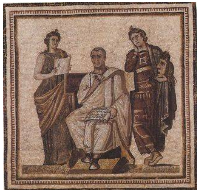
Fig. 147 - Le poète Virgile et deux Muses. Sousse (musée de Bardé), 120 x 120 cm.